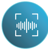
Guía de voz