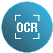
Reconocimiento óptico de caracteres

Los ciclos de trabajo más altos y los intervalos de mantenimiento periódicos proporcionan un mayor volumen con menos llamadas para mantenimiento de rutina, para mantener el enfoque en la productividad.