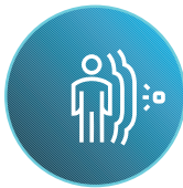
Sensor de movimiento